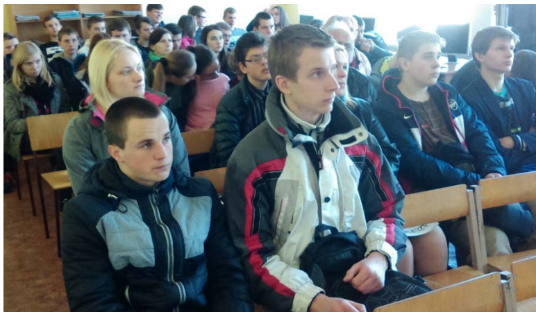
Svečiai iš rajono mokyklų

Žiuri komisijai suskaičiavus rezultatus paaikškėjo, kad proto mūšyje nugalėjo Jono Biliūno gimnazijos komanda.