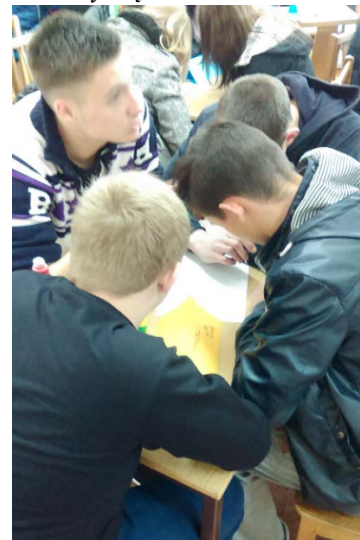
Protų mūšis „Pažink profesiją“