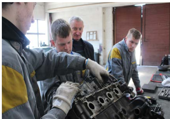
Praktinio mokymo dirbtuvėse

Mokiniai dalyvavo praktinėje veikloje „Pasimatuok profesiją“, kurios metu apžiūrėjo mokyklos praktinę bazę, „matavosi“ technikos priežiūros verslo darbuotojo bei tarptautinių vežimų vairuotojo ekspeditoriaus specialybes.